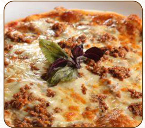
MINCED BEEF PIZZA $80

French fries, crisped bacon, baked mozzarella cheese 炸薯條、煙肉脆、烤馬蘇里拉芝士