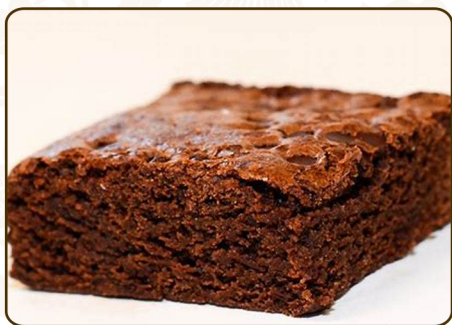
Chocolate brownie 巧克力布朗尼