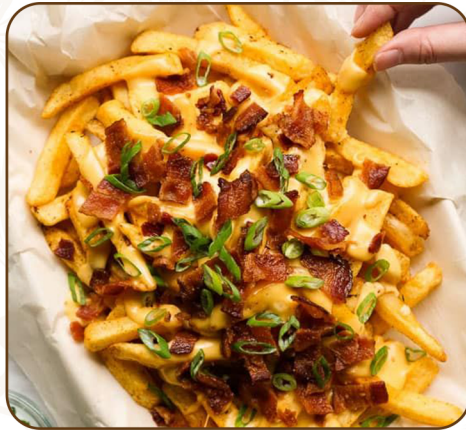
CAJUN FRIES $80

Romain Lettuce hearts, classic Caesar dressing 生菜心, 經典凱撒醬