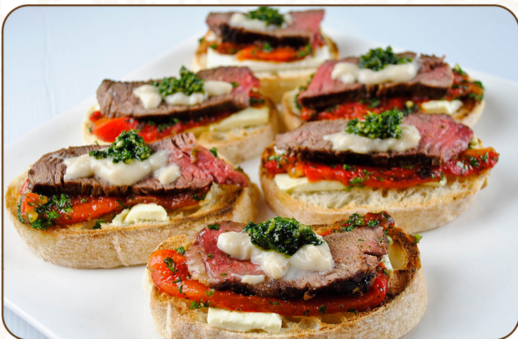
BACON & BEEF SANDWICH