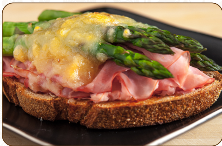
HAM & ASPARAGUS 火腿和蘆筍