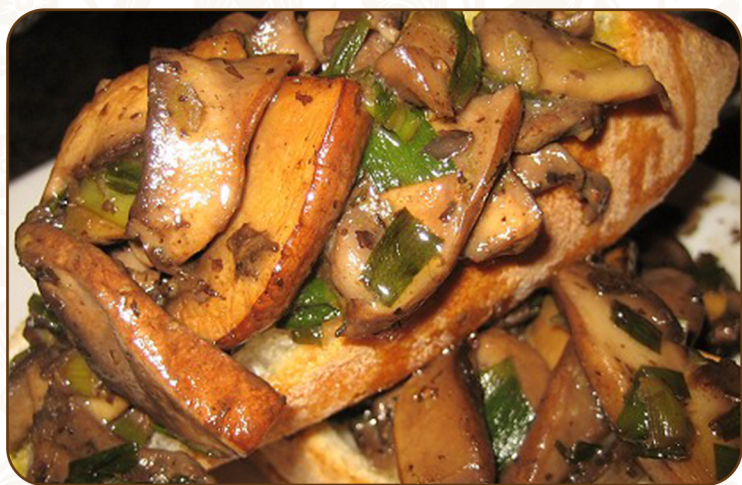
TRUFFLE & MUSHROOM 松露和蘑菇