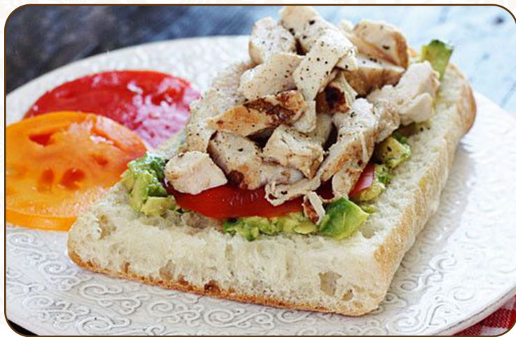
CHICKEN & AVACADO 雞肉和牛油果