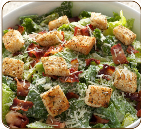
CAESAR SALAD $75

3 PM TO 5 PM 下午 3 點到 5 點 | MON - FRI 星期一至星期五