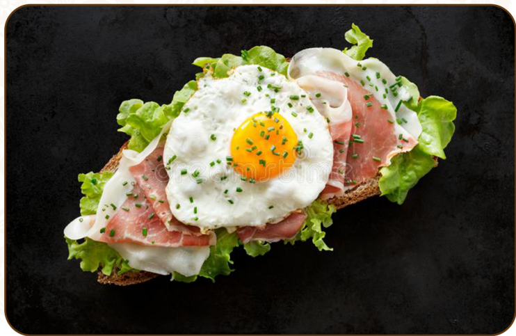
FRIED EGG & HAM SANDWICH 煎蛋火腿三文治